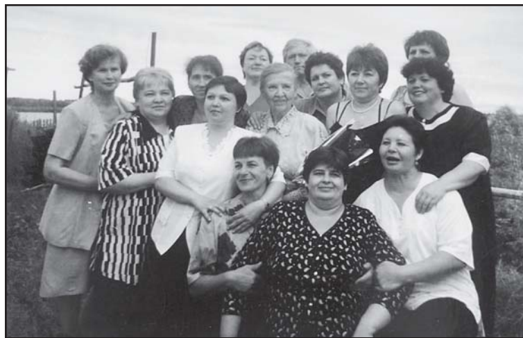
Встреча выпускников спустя 25 лет

Сергеевна не только проводила познавательные беседы, классные часы – она, можно сказать, жила нашими радостями и проблемами. «Болела» за