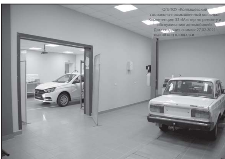
ОГБПОУ «Колпашевский социально-промышленный колледж» Компетенция: 33 «Мастер по ремонту и обслуживанию автомобилей» Дата создания снимка: 27.02.2021 Одний вид площадки