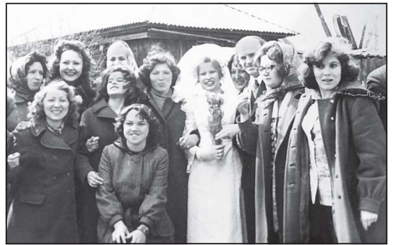
Ах, эта свадьба пела и плясала (мы на студенческой свадьбе)