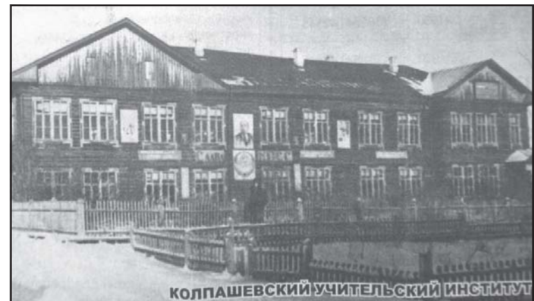
КОЛПАШЕВСКИЙ УЧИТЕЛЬСКИЙ ИНСТИТУТ