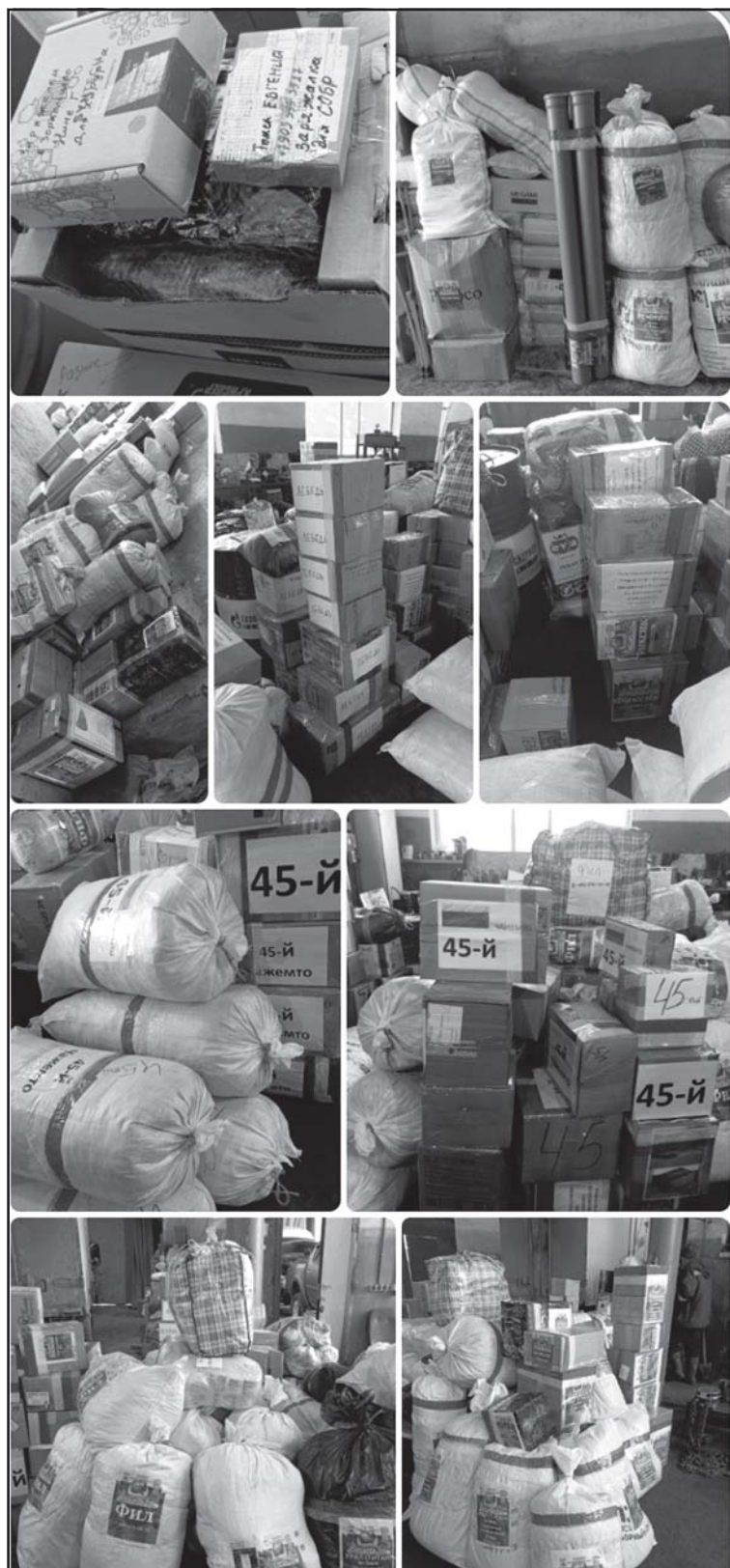
Отправка гуманитарной помощи

– вещи (термобелье – более 100 шт., сапоги ПВХ утепленные, резиновые, тактические ботинки, тактические перчатки, рабочие перчатки, теплые вещи, трусы, носки про-