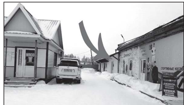
Здесь мы работаем

Помочь в сборе добровольцев (одежда, обувь, палатки, тактические рюкзаки, нательное