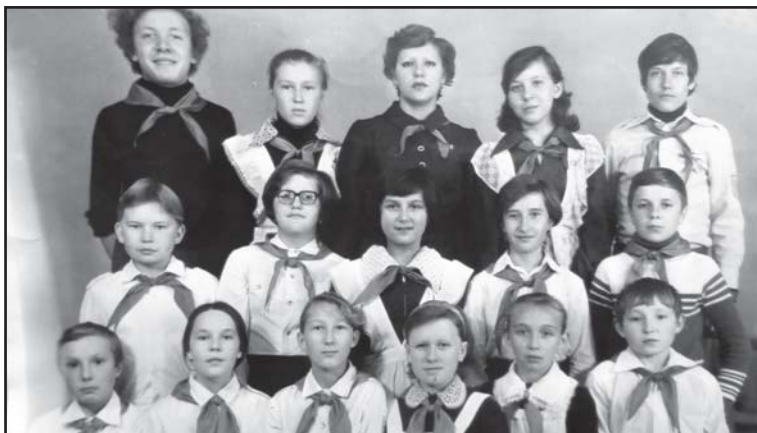
Совет дружины шк. №1