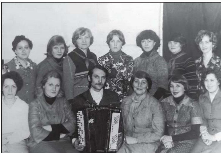
Вожатые и методисты Дома пионеров