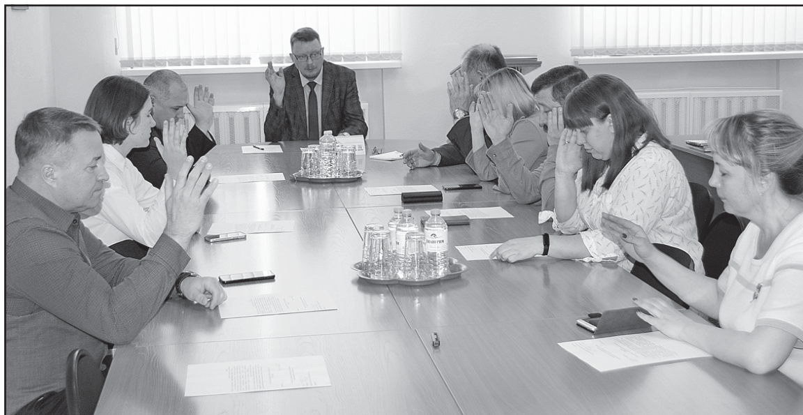
Общественная муниципальная комиссия единогласно поддержала направления работ по благоустройству городских общественных территорий, намеченных на 2024 год

В Колпашеве на спортивном стадионе Городского молодёжного центра продолжатся работы по его реконструкции (III этап). В текущем году намечены устройство входной группы, ограждения, подготовка основа-