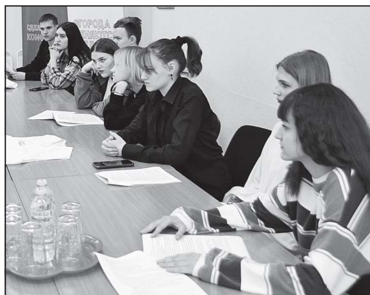
Группа волонтёров готова к оказанию помощи жителям в рейтинговом голосовании. Все добровольцы прошли необходимое обучение