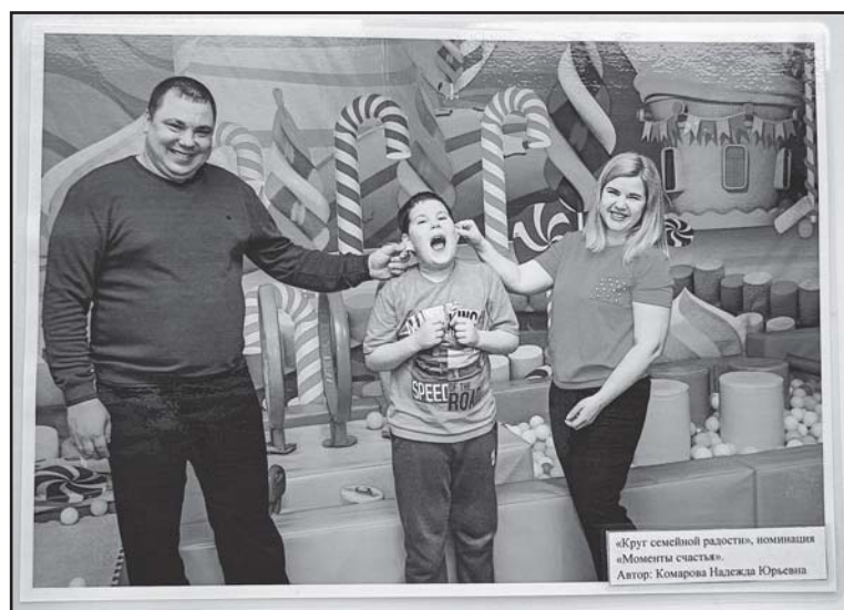
«Круг семейной радости», номинация «Моменты счастья». Автор: Комарова Надежда Юрьевна