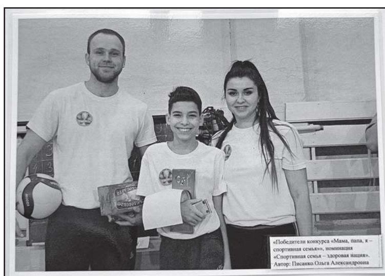
«Победители конкурса «Мама, папа, и спортивная семья», номинация «Спортивная семья – здоровая нация». Автор: Писанко Ольга Александровна

III место – Писанко Ольга Александровна с фотографией «Победители конкурса «Мама, папа, я – спортивная семья», номинация «Спортивная семья – здоровая нация».